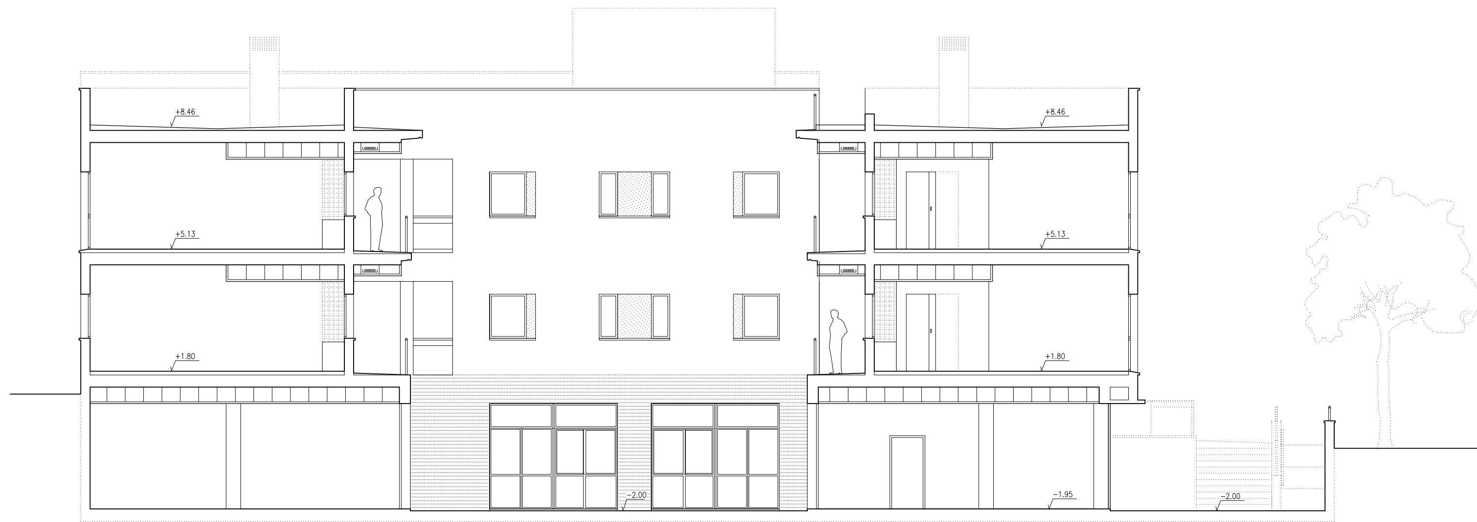
Sección transversal G-G'