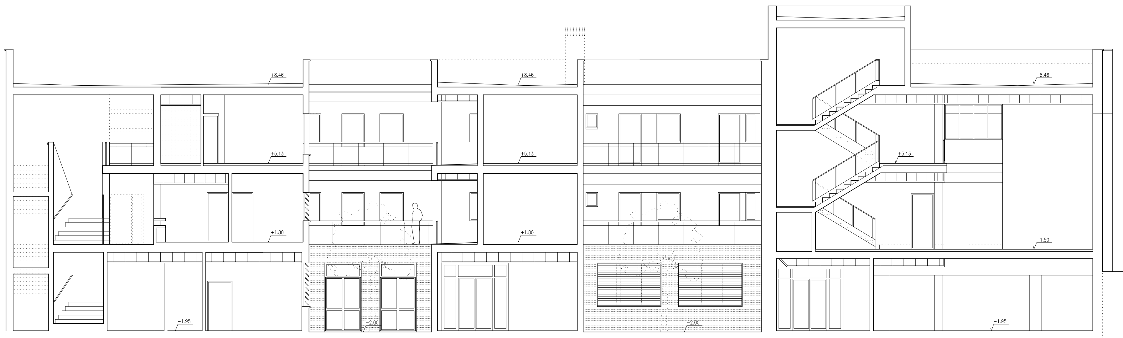
Sección transversal H-H'

PROYECTO BÁSICO Y DE EJECUCIÓN DE OBRAS DE ADECUACIÓN DE LOCAL PARA CENTRO DE DÍA Y OFICINAS DE SERVICIOS SOCIALES CALLE ANFITEATRO, 40 CARMONA ( Sevilla )